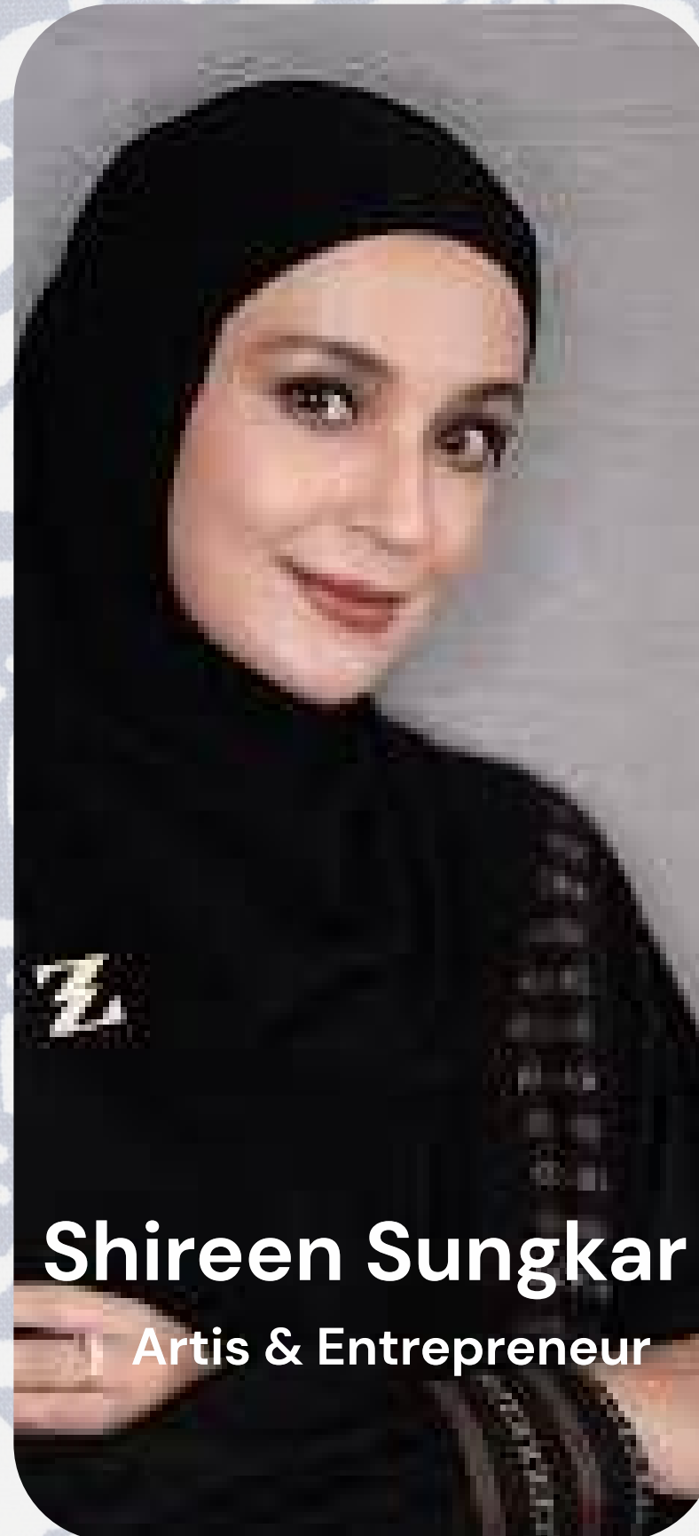
Shireen Sungkar Artis & Entrepreneur